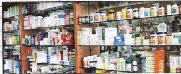
النظام الجديد هل يحل مشكلات الدواء؟

قرار تحرير أسعار الصرف إلا أن ذلك لم ينفذ. وطلب وزارة الصحة بإعادة النظر في نظام تسجيل المستحضرات الطبية بالوزارة والقائد على نظام البوكسات الذي لا يسمح سوى بتسجيل ١٢ شركة لنفس المستحضر الدوائي لافتاً إلى أن هذا النظام أدى لوجود احتكاكات في سوق الدواء المصرية حذر منه جهاز حماية المنافسة ومنع للاحتكاكات الذي طالب بالغاء هذا النظام في ظل تواجد العديد من المستحضرات الطبية التي لا يزيد عدد منتجها على اثنين فقط والـ ١٠ الآخرين حصلوا على الرخصة لانتاج فعلي.